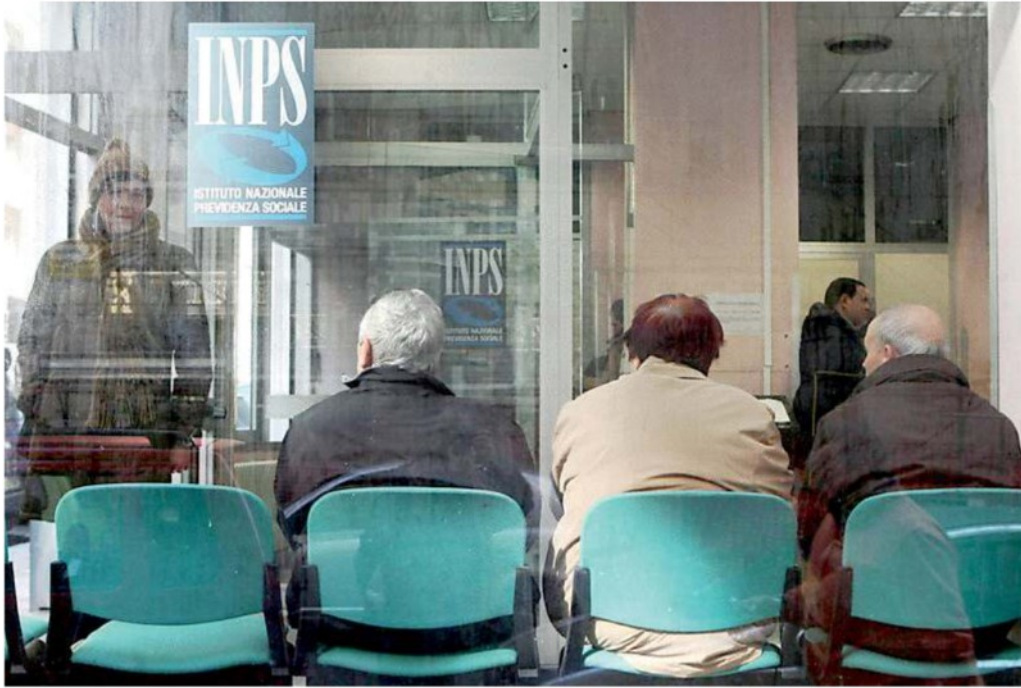
Alcuni pensionati in attesa in un ufficio dell'Inps