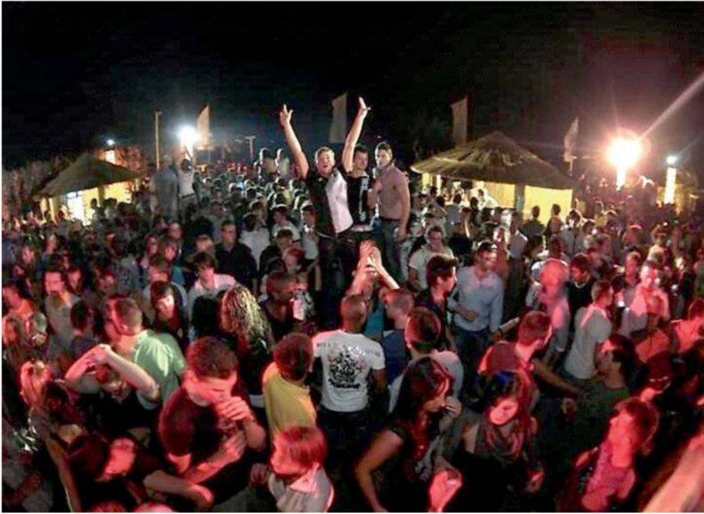
Giovani a Chioggia durante l'estate