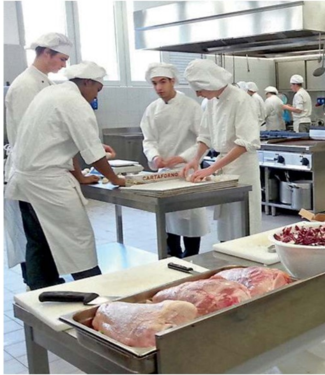
IL DIEFFE DI NOVENTA PADOVANA ALCUNI STUDENTI AL LAVORO IN CUCINA