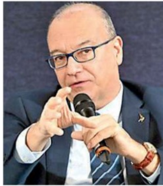
GIUSEPPE VALDITARA MINISTRO DELL'ISTRUZIONE E DEL MERITO