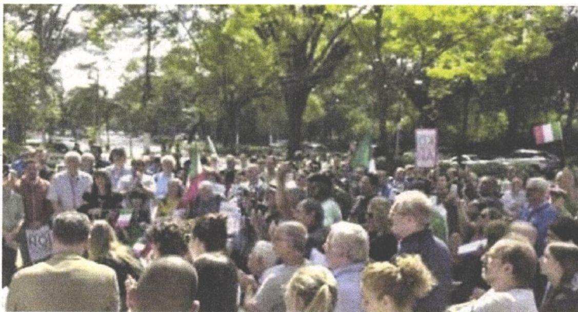
IN BRASILE A San Paolo si è tenuta una manifestazione contro il decreto Cittadinanza