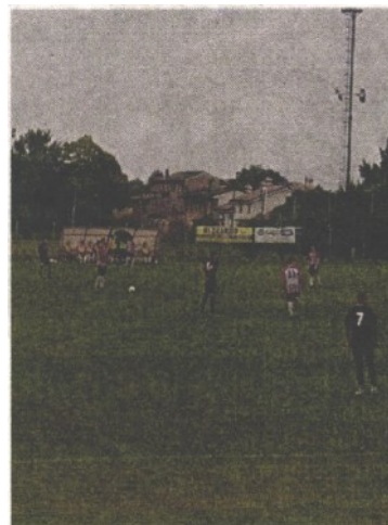
IN CAMPO Un momento del match